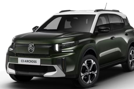
WDM0 – Zelena Montana