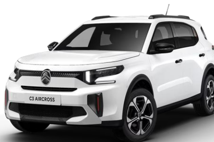
WPP0 – Bela Banquise