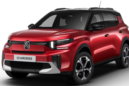
VHM0 – Rdeča Elixir