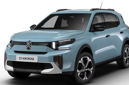
7AP0 – Modra Monte Carlo