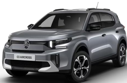
SXM0 – Siva Mercury