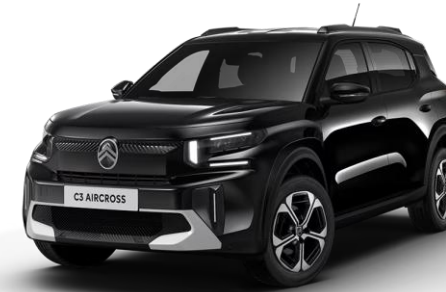
9VM0 – Črna Perla Nera

*Dvobarvna zunanost opcijsko na nivoju opreme YOU in YOU pack PLUS (300 €) in MAX serijsko. Barvi Rdeča Elixir (VHM0) in Zelena Montana (WDM0) izključno samo v dvobarvni izvedbi, kar pomeni da je na nivojih opreme YOU in YOU pack PLUS cena omenjenih dveh barv višja za 300 € .