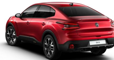
VHM5 – Rdeča Elixir