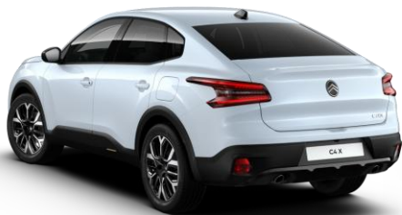
SUM0 – Bela Okenite

N – navadna barva, K – kovinska barva, P – posebna barva