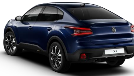
6LM0 – Modra Eclipse