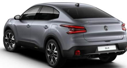
SXM0 – Siva Mercury