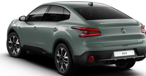
EMPO – Zelena Manhattan

N – navadna barva, K – kovinska barva, P – posebna barva