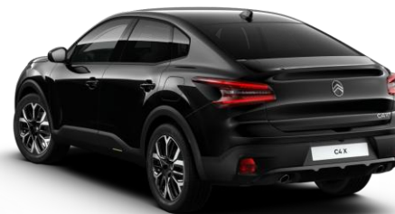
9VM0 – Črna Perla Nera