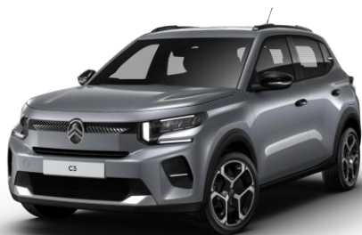
SXM0 – Siva Mercury