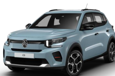
7AP0 – Modra Monte Carlo