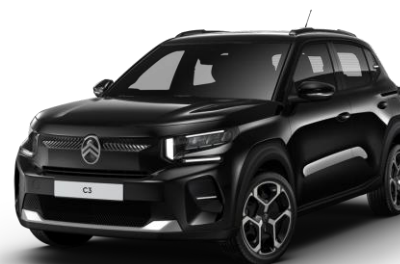
9VM0 – Črna Perla Nera