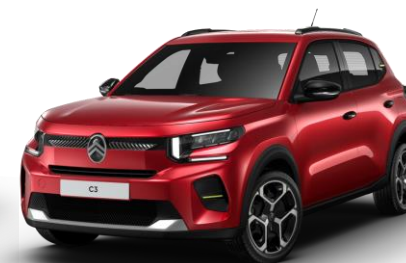
VHM5 – Rdeča Elixir