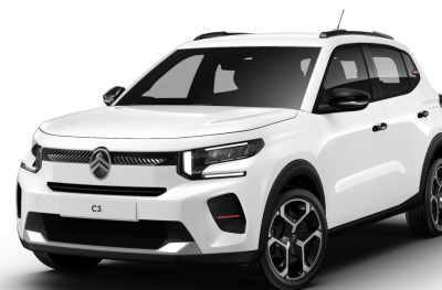
WPP0 – Bela Banquise