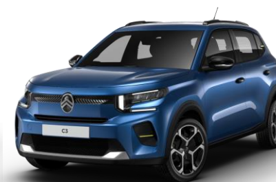
RDM0 – Modra Bright